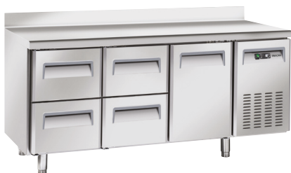
BCC3 - 221 S