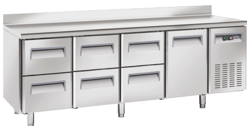
BCC4 - 2221 S