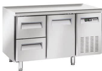
BCC2 UB - 21 S