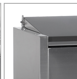
Rustfrit stålåg for beskyttelse af fødevarer